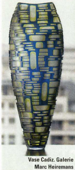
Vase Cadiz. Galerie Marc Heiremans